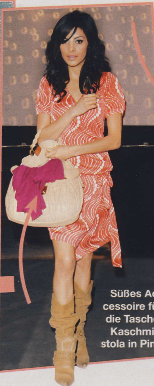
Süßes Accessoire für die Tasche: Kaschmirstola in Pink