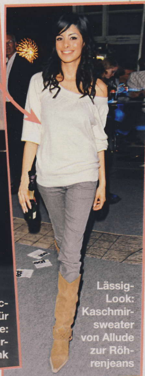
Lässig-Look: Kaschmirsweater von Allude zur Röhrrenjeans

Kasch mich! Kaschmir ist nur was für den Winter? Von wegen! Collien trägt jetzt Wrapdress, Pulli und Stola vom deutschen Kaschmirlabel Allude und siehe da – die Edelwolle bringt sie nicht ins Schwitzen. Im Gegenteil: Sommerkaschmir kühlt nämlich bei Hitze genauso, wie es bei Kälte wärmt. Hitzefrei mit Stil!