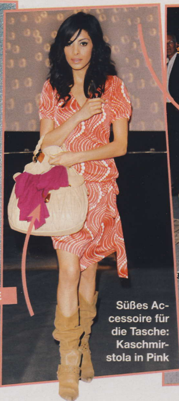
Süßes Accessoire für die Tasche: Kaschmirstola in Pink